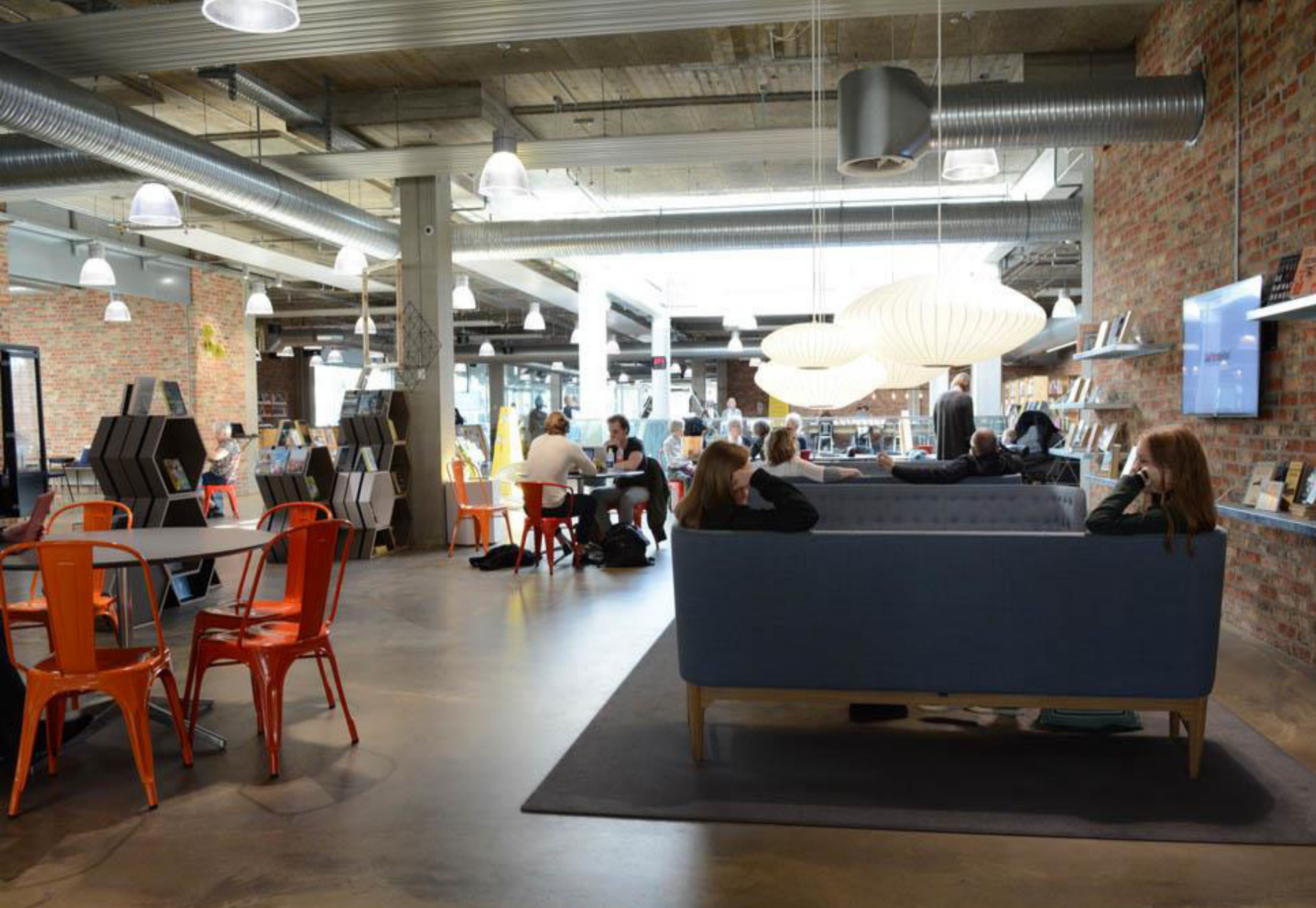
Herning Library, Danimarca