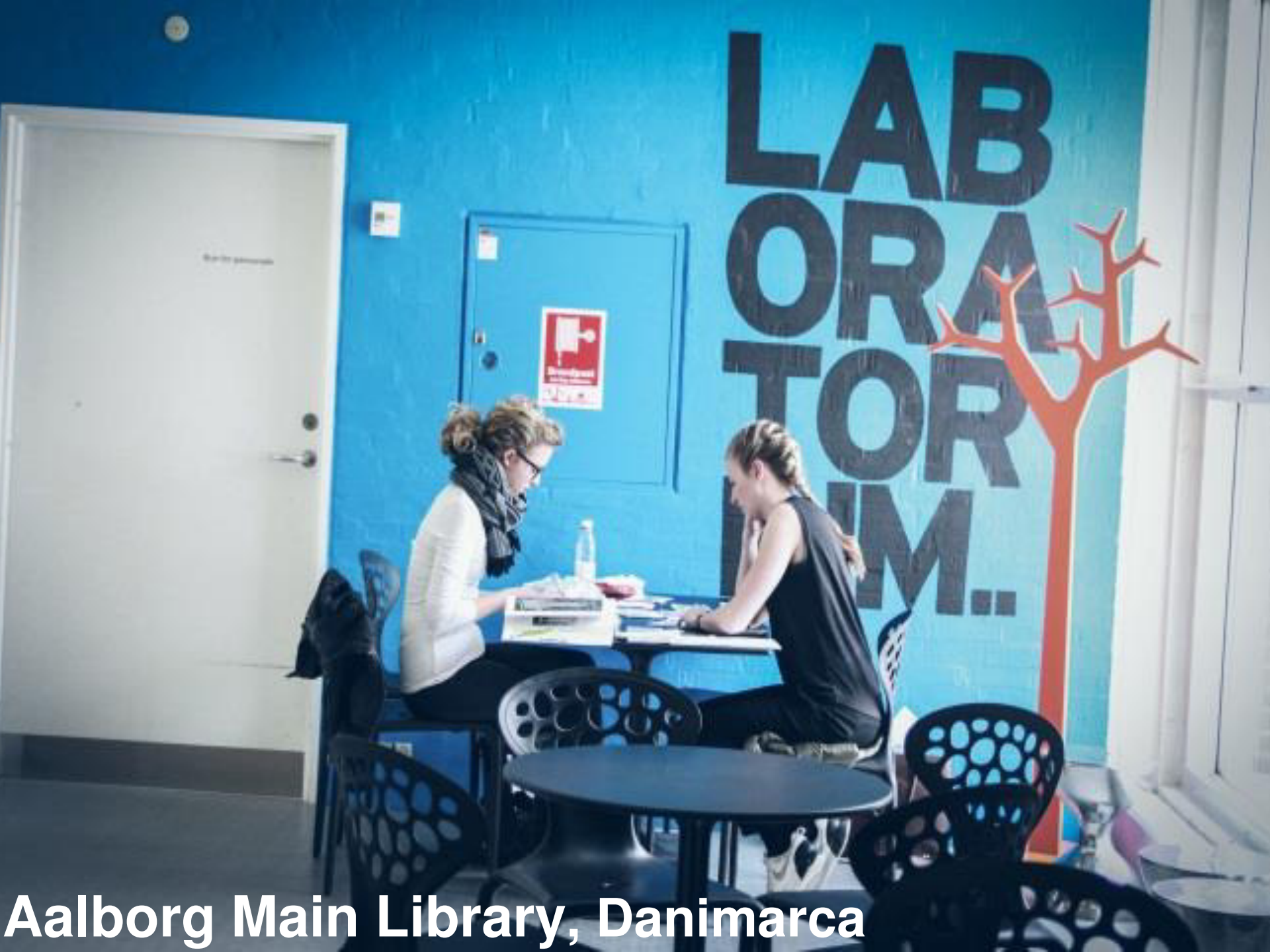
Aalborg Main Library, Danimarca