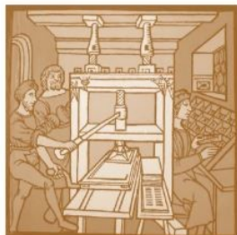
"Les Imprimeurs ont fait les livres, et les livres, à leur tour, ont dispersés les Imprimeurs"

LA STORIA DELLA STORIA DEL LIBRO 50 ANNI DOPO «L'APPARITION DU LIVRE»